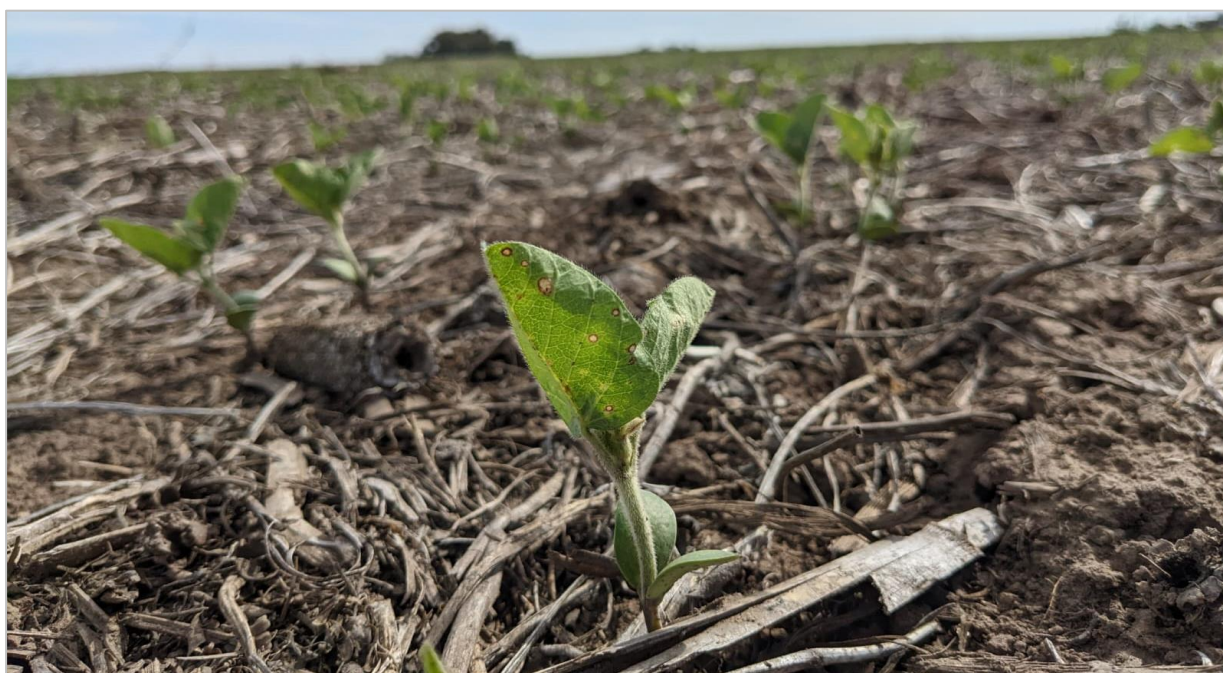
Soja de primera en emergencia. Coronel Moldes, Córdoba (15/11/22)

La falta de humedad superficial sobre importantes sectores del centro del área agrícola podría continuar condicionando el avance de las sembradoras siendo el sur de Santa Fe y el norte de Buenos Aires las regiones más afectadas. Colaboradores sobre las mencionadas regiones reportaron una mayor intención de siembra de soja de primera como consecuencia del abandono de cuadros de cereales de invierno y la imposibilidad de concretar los planes de siembra de maíz temprano. Sin embargo, dicha intención depende de las lluvias en el corto plazo que mejoren la humedad de los primeros centímetros del perfil y permitan el avance fluido de las sembradoras.