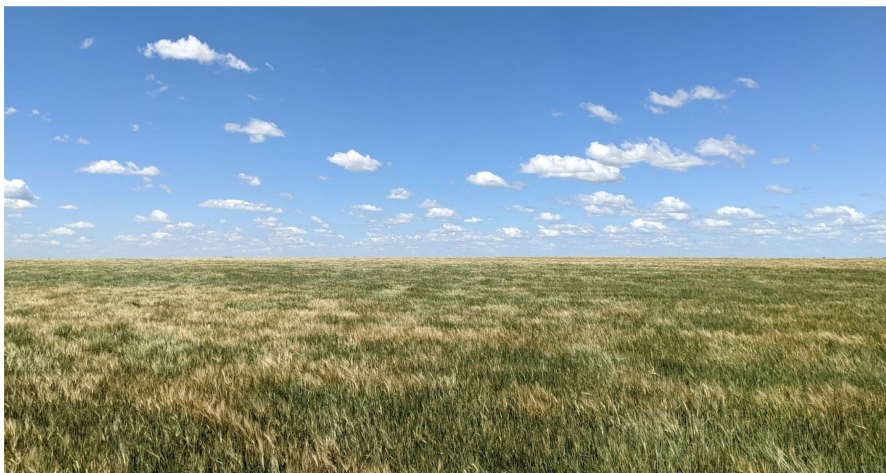
Cebada con daño producto de las heladas tardías. Balsa, Buenos Aires (15/11/22)

Los núcleos continúan sumando cuadros a las pérdidas de área cosechable. La falta de humedad durante todo el ciclo del cultivo sumado a las frecuentes y severas heladas durante el mes de octubre no solo afectó el crecimiento del cultivo sino también la formación de los componentes de rendimientos. Las expectativas de cosecha de ambas zonas se mantienen un 40 % por debajo al rinde medio de las últimas 5 campañas mientras que las pérdidas de área serían las más altas desde la 2015/16. Se espera que las labores de cosecha comiencen en los próximos quince días sobre el Centro-Norte de Córdoba y Santa Fe.