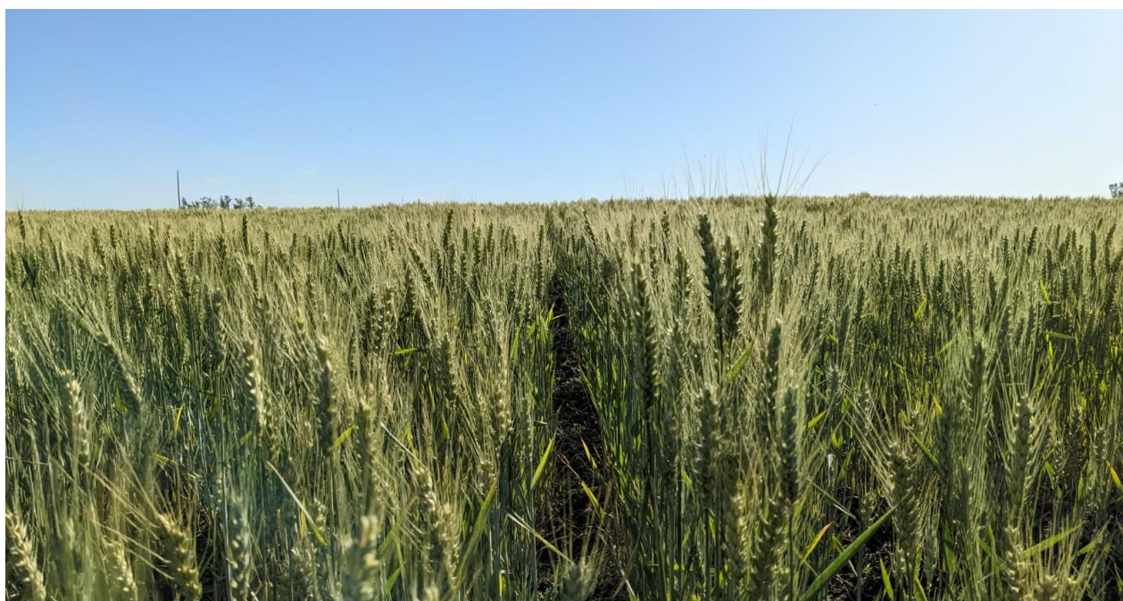
Trigo en estado regular en grano pastoso. Villegas, Buenos Aires (15/11/22)

En paralelo, sobre el centro del área agrícola, lluvias registradas el pasado fin de semana mejoran el escenario para siembras tardías, sin embargo, no se esperan mejoras en los rendimientos esperados. La falta de humedad a lo largo de la campaña junto a las frecuentes heladas registradas durante el mes de octubre generó pérdidas de hasta un 50%, siendo el norte de Buenos Aires la región más afectada. Mientras tanto, el Norte de La Pampa-Oeste de Buenos Aires, Centro de Buenos Aires y Sudeste de Buenos Aires reportan una importante heterogeneidad en el crecimiento y sobre los rendimientos esperados. Las altas temperaturas proyectadas para las próximas semanas podrían acelerar el proceso de llenado y afectar los rendimientos esperados mientras gran parte de los cuadros se encuentran en grano pastoso.