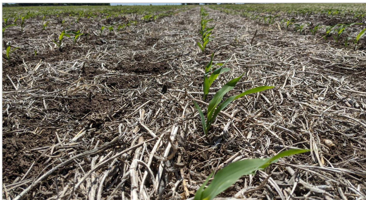
Lote de maíz temprano en buen estado. Lincoln, Buenos Aires (14-11-22).

Hacia las provincias de Córdoba y San Luis, las lluvias mejoran las condiciones para la recuperación de cuadros afectados por heladas tardías. En los Núcleos Norte y Sur se espera iniciar las refertilizaciones nitrogenadas durante los próximos días. Sobre la zona Centro-Norte de Santa Fe, se registran daños puntuales provocados por lepidópteros que están siendo controlados. Por otro lado, los colaboradores mencionan los primeros cuadros iniciando el panojamiento.